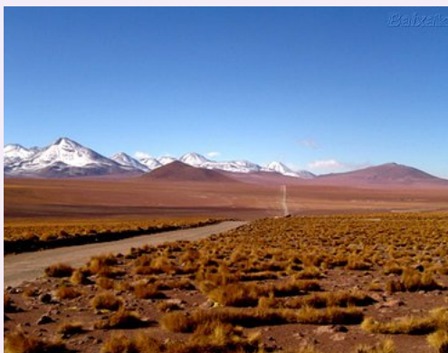
Deserto do Atacama